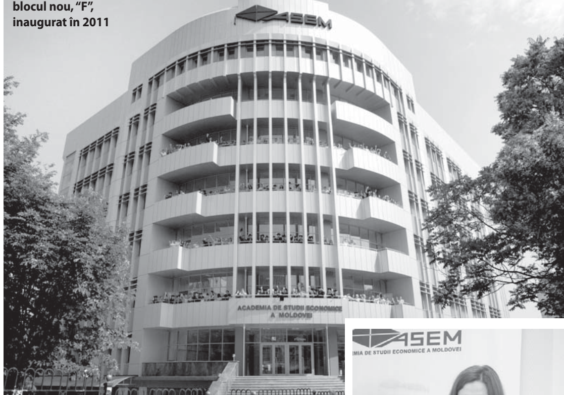
Perla Campusului Universitar ASEM, blocul nou, "F", inaugurat în 2011

Academia de Studii Economice din Moldova (ASEM) a fost înființată la 25 septembrie 1991, conform Hotărârii nr.537 a Guvernului Republicii Moldova.